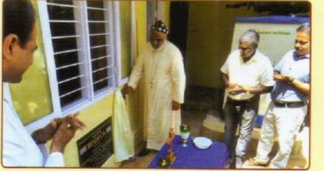
மிட்ஸ் சூரிய ஒளி மின் திட்ட துவக்கவிழா