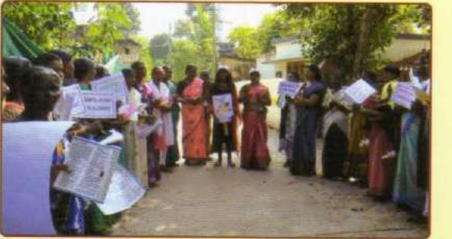
பற்றுநோய் விழிப்புணர்வு பிரச்சாரம்