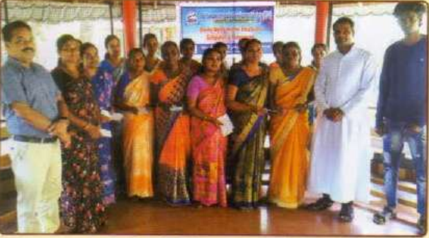
டிவைன் மெர்சி உயர்கல்வி திட்டம்