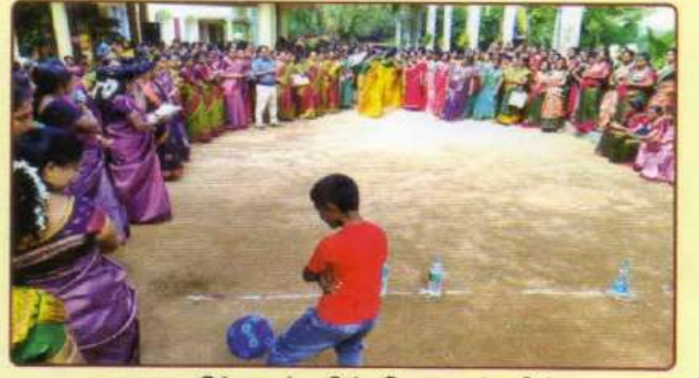
சுய உதவிக்குழுக்களின் பொருளர்களின் விளையாட்டு போட்டி