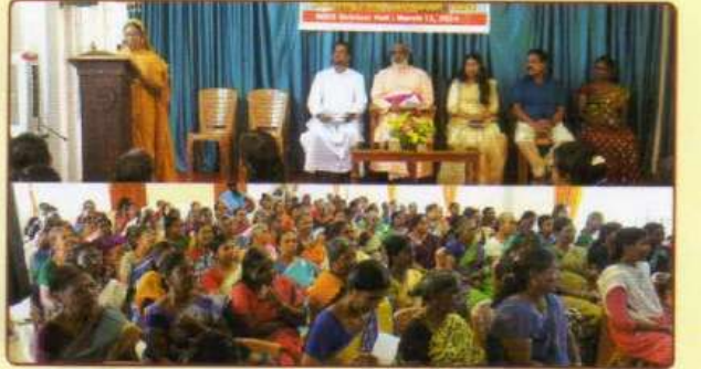
மிட்ஸ் மரியன் இயக்க தொழிற் கடனுதவி வழங்கும் நிகழ்வு