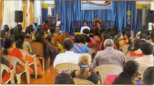
கோள்பிங் குடும்பங்களுக்கு கக்கரா கடன் வழங்கும் நிகழ்வு