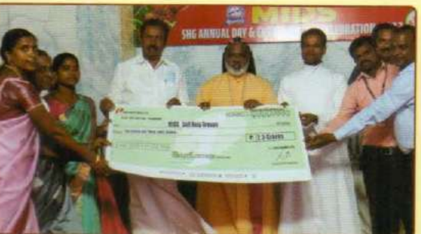
ஐசிஐசிஐ வங்கியின் சிறுதொழில் கடனுதவி திட்டம்