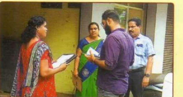
மிட்ஸ் குடும்ப வளர்ச்சி திட்ட மதிப்பீடு பார்வை