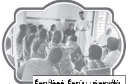
கோயிக்கத் தோப்பு பங்களிவில் திட்ட பரவலாக்கம்

நம் சமூகத்தில் விளிம்புநிலை குடும்பங்களில் வாழும் குழந்தைகள் சூழல் காரணமாக காப்பகங்களில் அனுப்பி வைக்கப்படுகின்றனர். காப்பகங்களில் பாதுகாப்பு, உணவு, உறைவிடம், கல்வி அனைத்தும் நிறைவாக கிடைத்தாலும், பெற்றோரின் அரவணைப்பின்றி உளநலபாதிப்போடு வளர்கின்றனர். குழந்தைகள் பெற்றோரின் பாதுகாப்பில் கிராமத்து கலாசாரத்தில் இணைந்து கஷ்டநஷ்டங்களை உணர்ந்து குடும்ப சூழலில் வளர்வதே குழந்தைகளின் எதிர்கால ஆரோக்கியமான வளர்ச்சியை உருவாக்கும். மேலும் குழந்தை திருமணங்கள், பாலியல் சீண்டல்கள், குழந்தைகளுக்கு எதிரான வன்கொடுமைகள் போன்ற தீமைகளுக்கு எதிராக குரல் கொடுக்க வேண்டியத நமது கடமையாகும்.