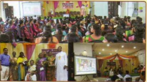
மகளிர் தினவிழா கருத்தரங்கு கூட்டம்