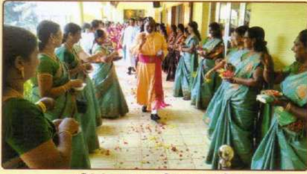
மிட்ஸ் சுய உதவிக்குழுக்களின் கிறிஸ்துமஸ் விழாவிற்கு ஆயரின் வருகை