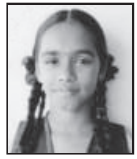
E.M. அனு வைஷாலி வகுப்பு - 8