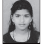
A. ஸ்னோ மெர்பின் ஜெனிக்ஷா வகுப்பு - 11