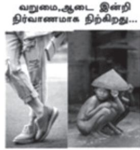
வறுமை, ஆடை இன்றி தீர்வானமாக தீர்கிறது... வளமை, உள்ளடை தெரிய ஊர்வலம் செல்கிறது...

இது இடத்துக்கு இடமும், காலத்திற்கு ஏற்பவும் மாறுகிறது. பொதுவாக சமூகத்தால் உணரப்படக்கூடிய, அடிப்படை மனித உரிமை இழப்பே வறுமை ஆகும். இவை உணவு, உடை, தங்குமிடம் என பொருள் பரிமாணத்தை சார்ந்தவை யாகவோ, பாலியல் மற்றும் சாதி வேற்றுமை போன்ற பொருள்சார் பரிமாணத்தை சார்ந்தவை யாகவோ இருக்கலாம். பொதுவாக உணவின்மையே வறுமை என நம்பப்படுகிறது. நாட்டின் எதிர்கால தூண்களான இன்றைய குழந்தைகளின் நிலைமை கவலையளிப்பதாக உள்ளது. உலகிலேயே வங்கதேசத்தை அடுத்து இந்தியாவில் தான் சரியான சத்தான உணவின்றி வறுமையில் இறக்கும் குழந்தைகள் அதிகம் உள்ளனர்.